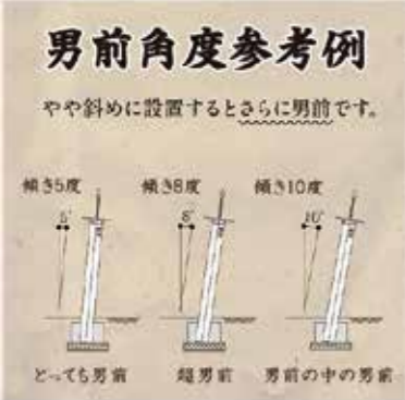
カタログに「斜めにすると更に男前」という表記が。さすが男前を極めるメーカーである